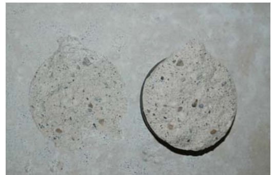
Korn am Ausriss sichtbar