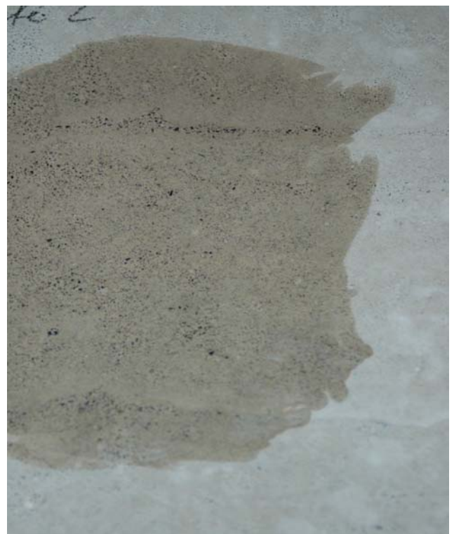
Benetzung mit Wasser Korn sichtbar